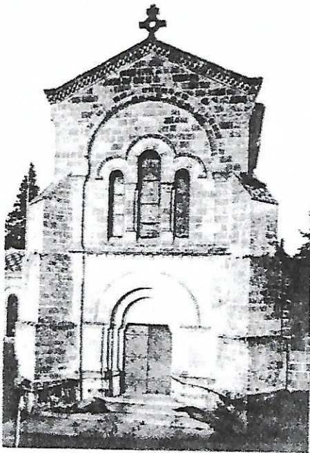
SAINTE-RUY. Clocher, entrée principale

L'entrée du chœur de l'église porte les statues de Saint Gervais et de Saint Protais édifiées par M. BELLOC en 1874.