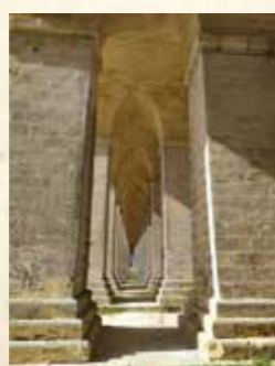
Photos du Pont Eiffel

Hébergements : camping Le Grain, 32 Avenue du Roy, 33440 Ambarès-et-Lagrange 06 87 20 56 43, se renseigner. Mairie : 05 57 43 02 11.